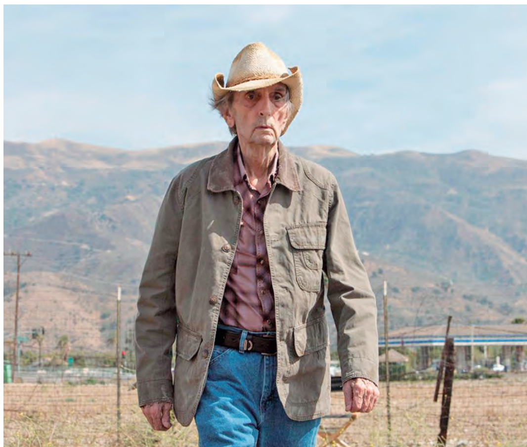
● Lucky (2017), de John Carroll Lynch, la última cinta de Harry Dean Stanton.