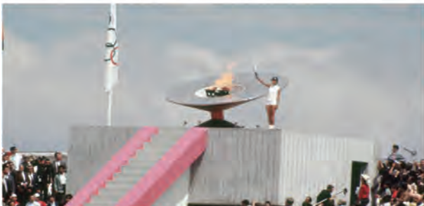
En 1968 el pebetero del Estadio Olímpico Universitario fue encendido, dando inicio a los Primeros Juegos Olímpicos con sede en la Ciudad de México.

▶ Inicio ciclo escolar 6 / Agosto / 2018