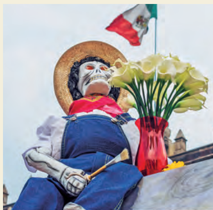
● Diego Rivera fue recordado en 2017.