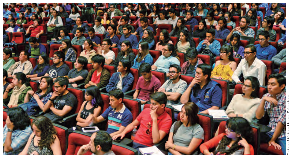
• En la Facultad de Ciencias Políticas y Sociales.

Finalmente, subrayó que esto no sólo corresponde fraguarlo a los jóvenes, sino también a todos los ciudadanos y se dijo escéptico de la labor de este sector de la población, pues “es un etapa que pasa”, por lo que el compromiso debe ser general. g