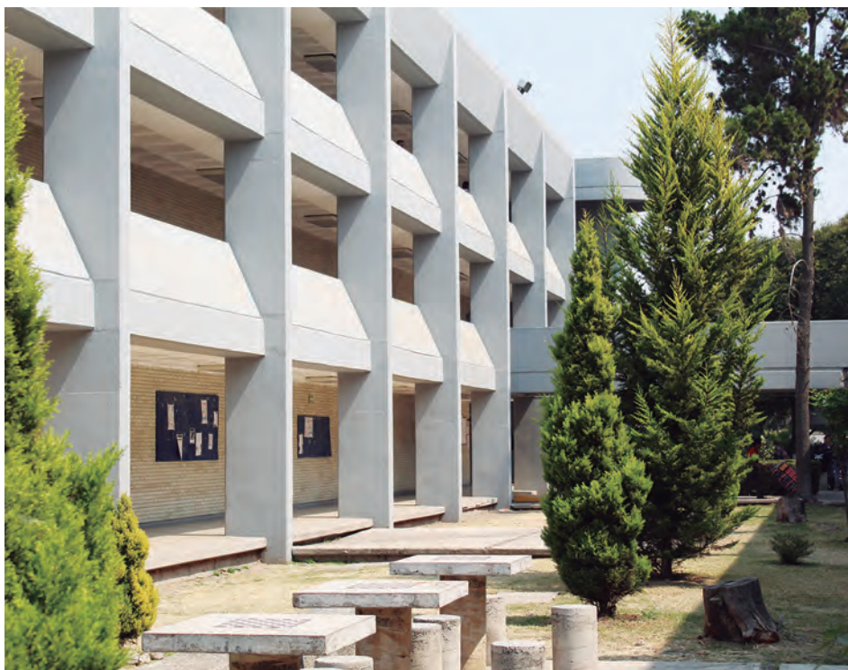
▲ Kaori Nayeli Sánchez Carrillo , alumna de la FES Cuautitlán. Área común .

Gaceta ilustrada es tuya Envía tus fotos de todos los territorios puma