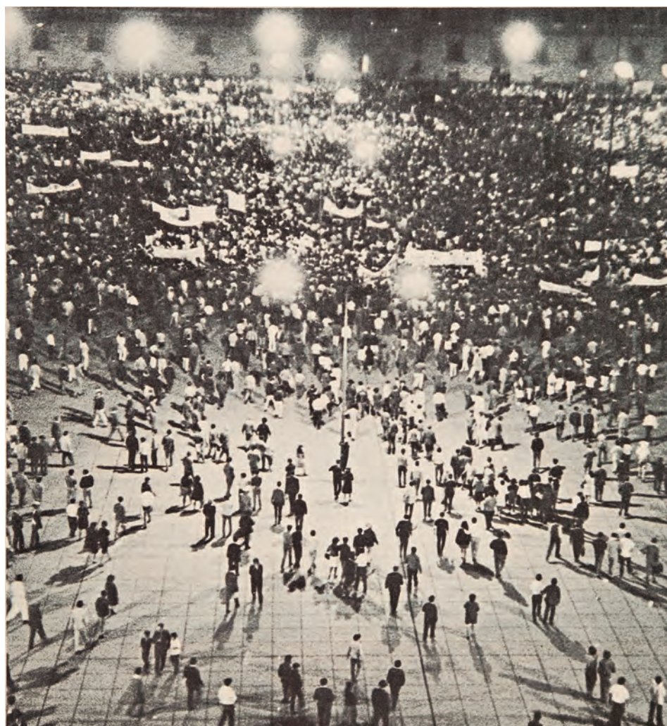
● El Zócalo de Ciudad de México en una de las protestas estudiantiles.