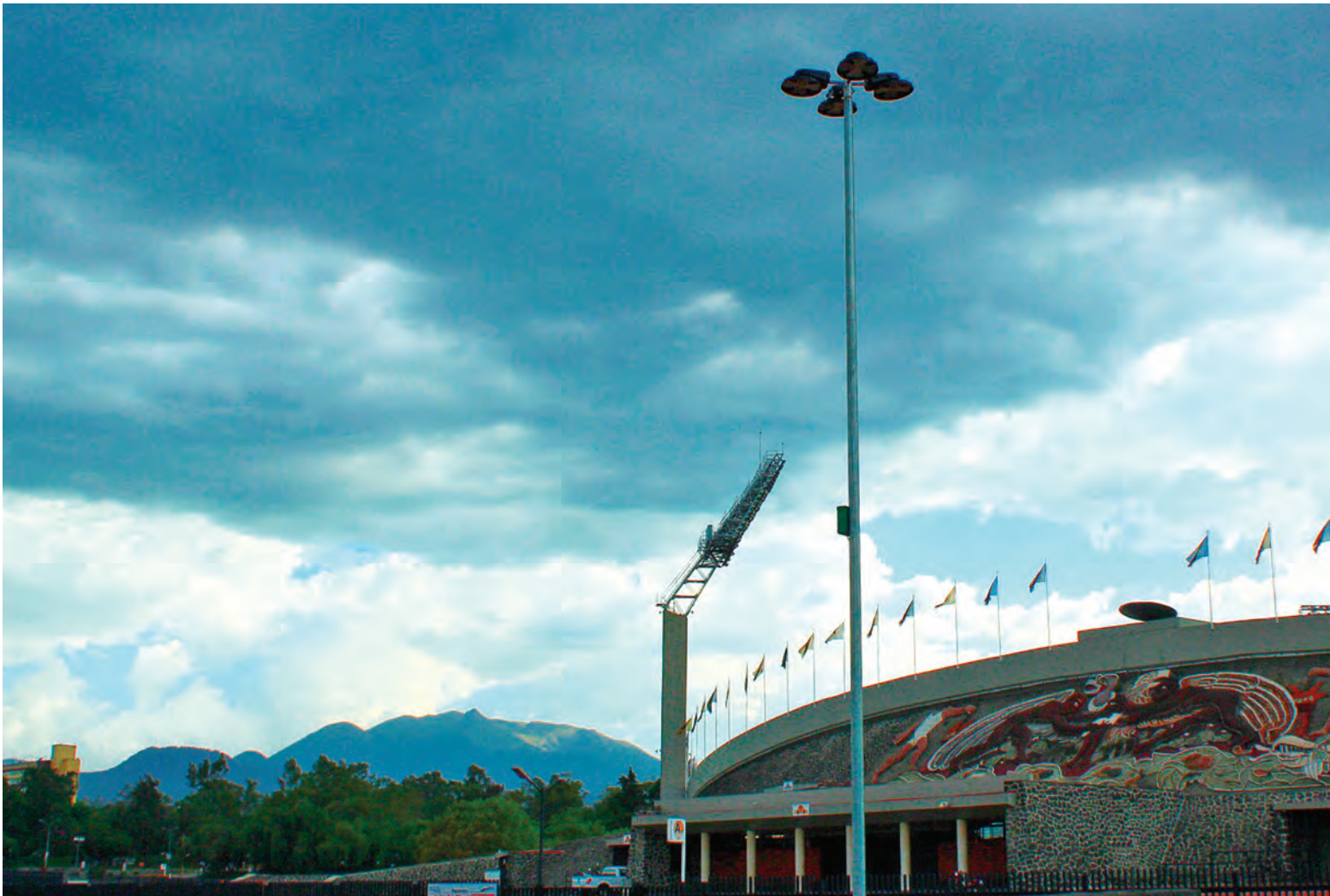
▲ Kali Anamim Solorio Osorio , alumna de la Prepa 2. Historia viviente.

Gaceta ilustrada es tuya Envía tus fotos de todos los territorios puma