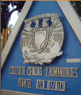
CCH Azcapotzalco (1971)

El proyecto del Colegio de Ciencias y Humanidades fue aprobado por el Consejo Universitario de la UNAM el 26 de enero de 1971, durante el rectorado del Dr. Pablo González Casanova.