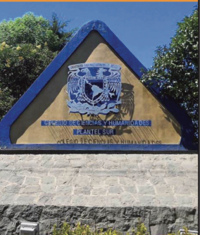
CCH Sur (1972)