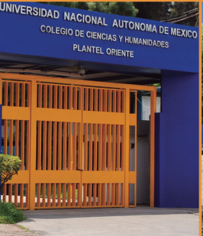
CCH Oriente (1972)