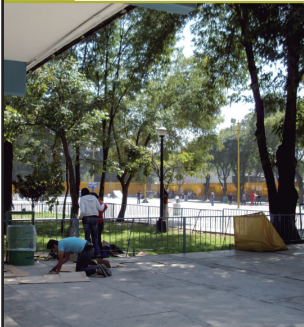
CCH Azcapotzalco (1971)

El proyecto del Colegio de Ciencias y Humanidades fue aprobado por el Consejo Universitario de la UNAM el 26 de enero de 1971, durante el rectorado del Dr. Pablo González Casanova.