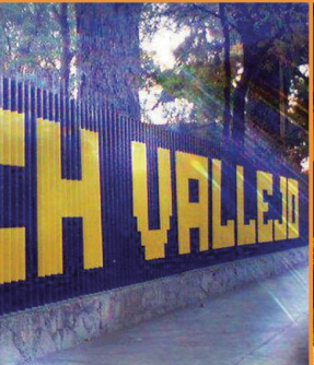
CCH Vallejo (1971)