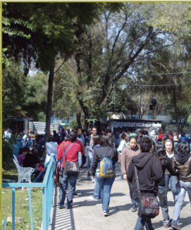
CCH Vallejo (1971)