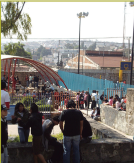
CCH Naucalpan (1971)