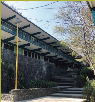
CCH Sur (1972)