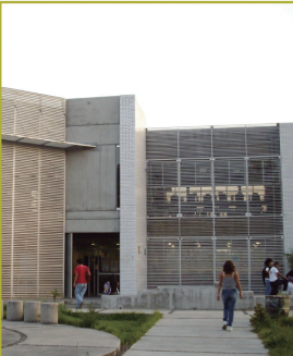
CCH Oriente (1972)