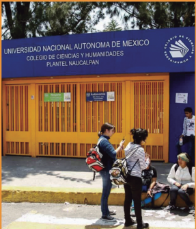
CCH Naucalpan (1971)