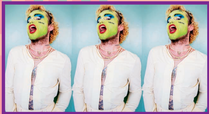
Glooptopia (Reino Unido).