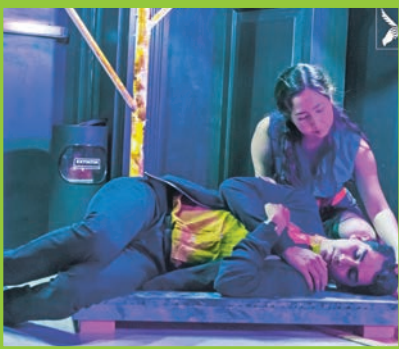
El alma buena de Sezuán.