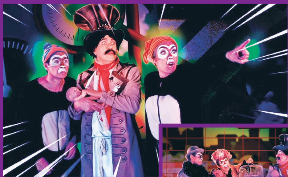
Mostro (México-Cabaret Misterio).