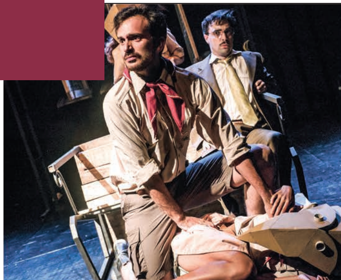
• El alma buena de Sezuán , Instituto Oviedo, León, Guanajuato.