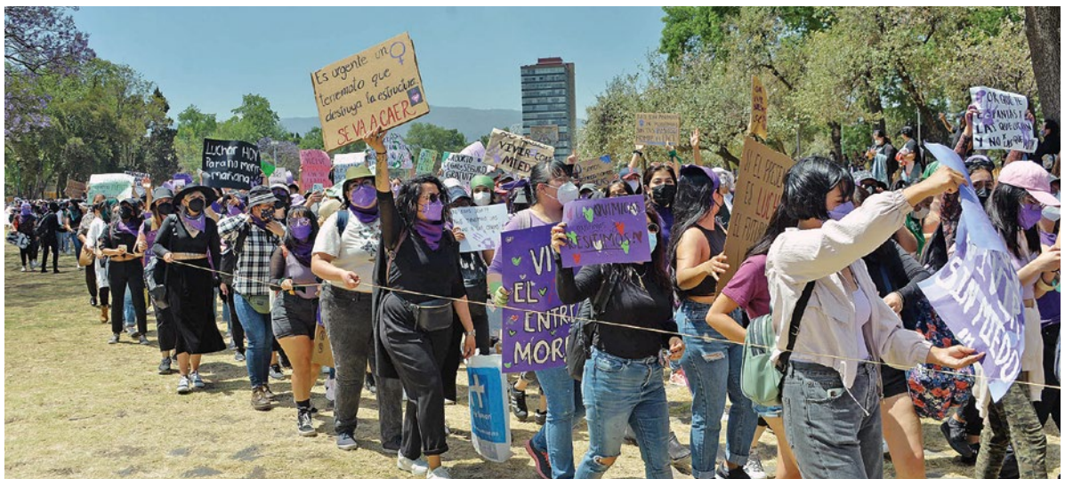
Contra la violencia de género.