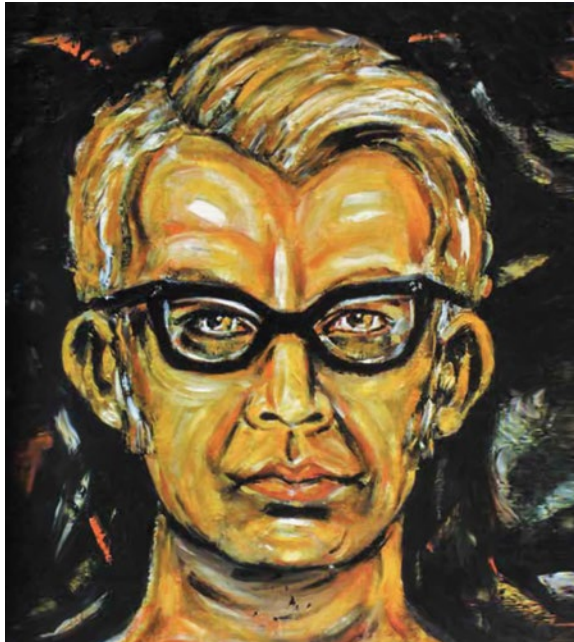
Acervo del ingeniero Heberto Castillo.