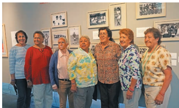
● Selección mexicana que participó en la Copa Mundial de 1971.